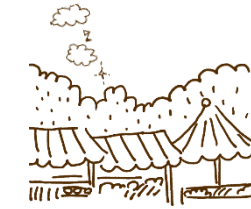
◀ボランティアの方が描いたイラスト