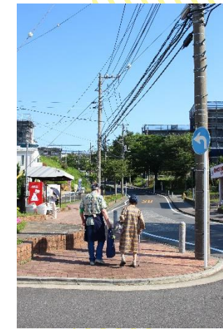
▲玄関先までお届けのお手伝い