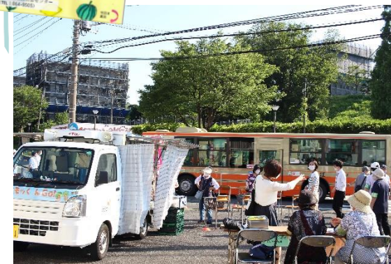
▲バス停そばでの風景