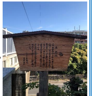
↑写真は高札マップ番号⑩

高札の場所が描かれたマップもあります。(1部100円) おすすめの高札巡りのコースかかれておりますので、ご興味のある方はケアプラザまでお問合せください