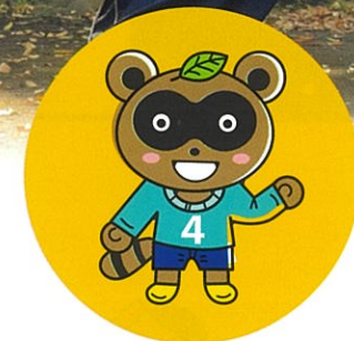
瀬谷第四地区マスコットキャラクター 「よんたくん」